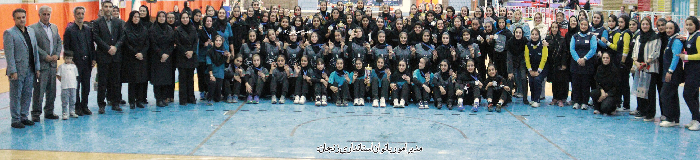
مدیر امور بانوان استانداری زنجان:

رونمایی از چهار تیم برتر زیر ۱۸ سال در زنجان